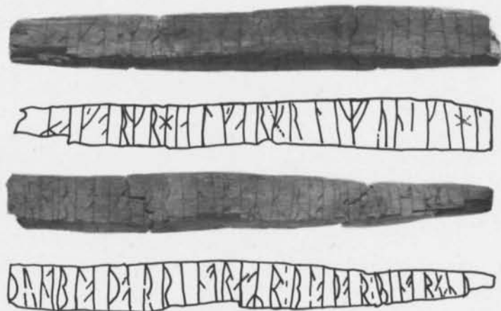
Fig. 8–9. Trästicka med runinskrift från Lödöse, S:t Peders socken, Västergötland. jämte ritning av H. Gustavson. — Wooden stick with runes from Lödöse, St. Peder parish, Västergötland.

hagormr hialgar-rii-unski-l-... 5 10 15 20 25