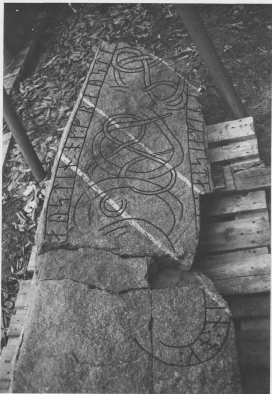
Fig. 6. Den återfunna rünstenen U 44 från Törnby, Skå socken, Uppland. — The rediscovered rune stone U 44, Törnby, Skå parish, Uppland.