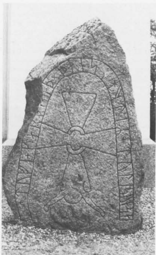
Fig. 10. Runstenen vid Appuna kyrka, Östergötland. — Rune stone from Appuna Church, Östergötland.

Inga uppgifter finns beträffande när och hur runstenen kommit att hamna i prästgår-