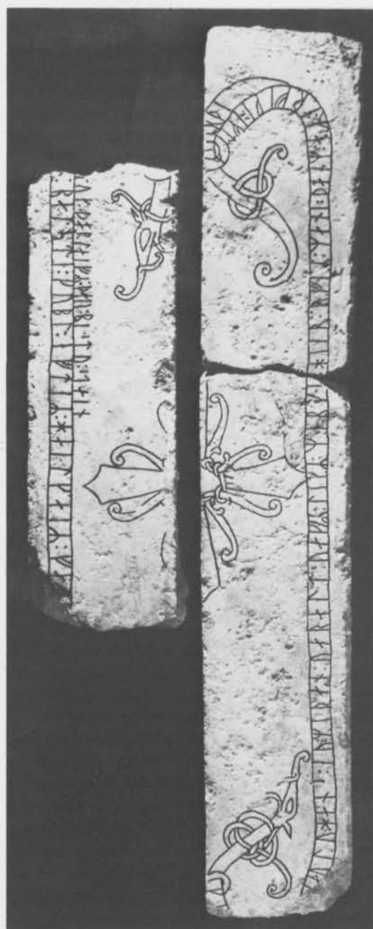
Fig. 1. Den runristade gravhällen från St Hans kyrkoruin i Visby. — Three fragments of a tombstone from the ruin of St. Hans, Visby.

lens ena kortsida som framgår av fig. 1. Centralmotivet på bildstenen torde ha varit ett virvelhjul med spiraler och längs sidorna har den varit prydd med en kantbård. Denna ålderdomliga bildsten har, såsom runstensornamentiken och runornas former visar, på 1000-talet huggits om till en runhäll. Rester av kalkbruk på fragmenten tyder på att hällen i helt eller, vilket verkar vara troligare, i sönderslaget skick har använts som byggnadsmaterial innan delar av den slutligen nyttjades som sidohällar i den medeltida gravkistan. Några nåltunt ristade och ytterst grunda runor, dels ett f , dels rester av 7–10 runor inom ett inskriftsband invid ena korsarmen kan bäst karaktäriseras som runklotter och torde ha tillkommit då stenstycket suttit inmurat i kyrkväggen. På andra sidan korsarmen finns liknande nåltunna streck, som inte kan bestämmas närmare.