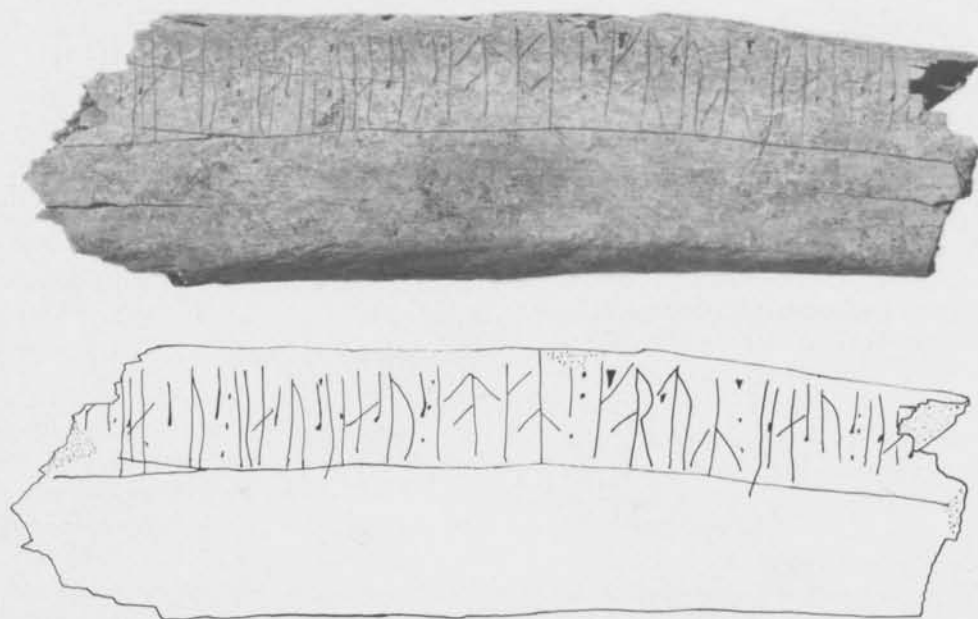
Fig. 3. Revben med runinskrifter från kv. Guldet i Sigtuna (fnr 317), sid. a. Foto G. Hildebrand (ATA), jämte ritning av A. Hildebrand. — Rib with runic inscriptions from the Guldet quarter, Sigtuna.

sontellt streck som går tvärs över fragmentet. Runhöjden är 17–20 mm. Av runa 1 k återstår endast huvudstavens bas samt mittparti med bistavens anslutning till denna. Resten av runan är borta i brottkanten. 2 s är ett kortkvist- s liksom övriga s -runor i inskriften. Den har en punktförmad avslutning. Toppen borta i brottet. 4 e är stungen med en punkt på huvudstavens mitt. Den vänstra bistaven i 5 æ skär över föregående runas huvudstav. 10 i är ej stungen. I 21 k går bistaven ända fram till följande runas topp. Mellan t -bistaven och huvudstaven i 28 du finns en punktartad fördjupning som bedöms vara en stingning. I 38 æ är bistavens högra spets och delar av huvudstavens övre hälft borta i brottet. Av 39 s återstår endast den punktförmade avslutningen.