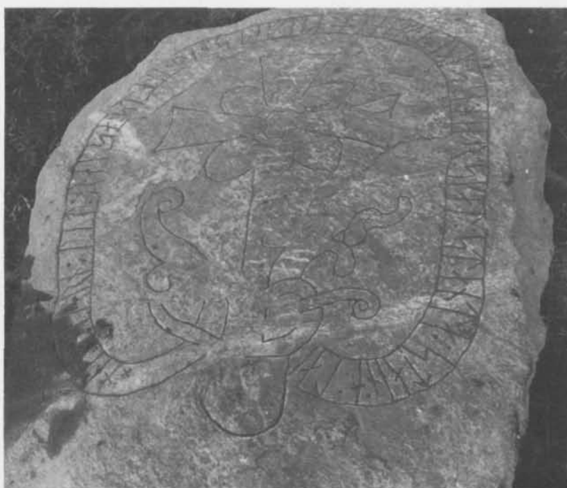
Fig. 2. Runsten från Bärmö gård, S:t Pers socken, Uppland. — Rune stone, Bärmö, S:t Per parish, Uppland.

tycks finnas belagda med säkerhet i runinskrifternas namnförråd utanför Gotland, där det möjligen också uppträder i namnen Hailfos och Hailvi i den nu förkommna runstenen G 136 Sjonhem.