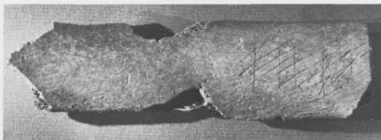
Fig. 5. Revben med runor från kv. Guldet i Sigtuna, fnr 364. — Rib with runes from the Guldet quarter, Sigtuna.

av liknande typ finns på en runsten vid Rotbrunna i Härnevi sn (U 1145).