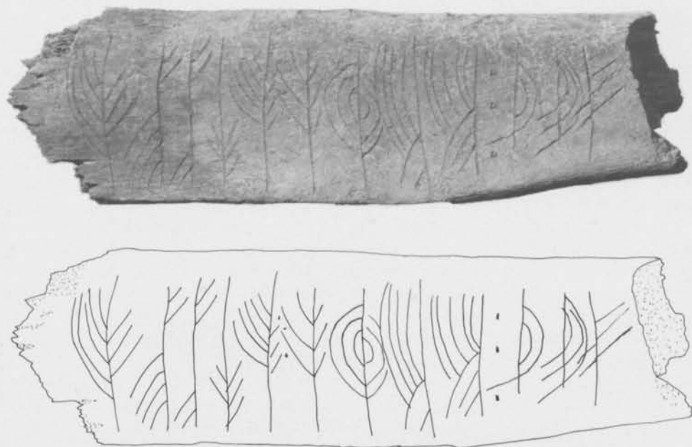
Fig. 4. Revben med runinskrifter från kv. Guldet i Sigtuna (fnr 317) sid. b. jämte ritning av A. Hildebrand. — Rib with runes from the Guldet quarter in Sigtuna.

tionsläran, varigenom kalken under nattvardsmässan innehöll Kristi blod. Därför kunde Kristus själv kallas för kalkens försvarare och väktare.